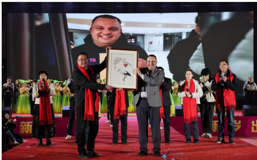
白俄罗斯外籍教师参加学校活动