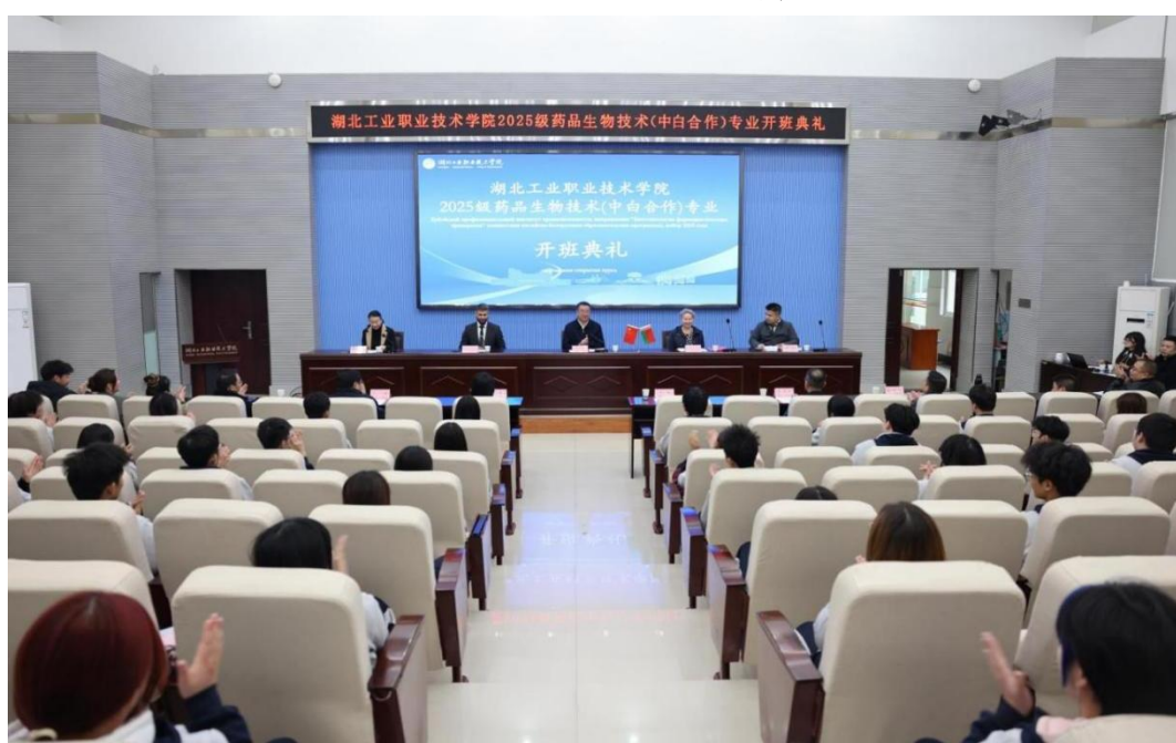
2025 级中白合作专业开班典礼