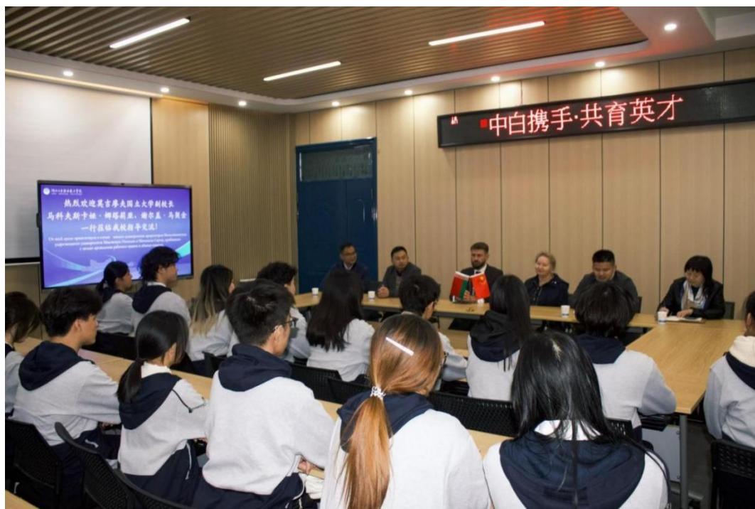
中外合作专业学生座谈会