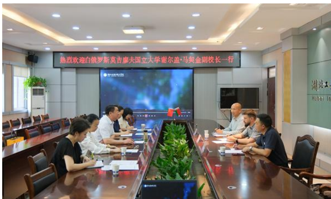
莫吉廖夫大学来访交流

白俄罗斯莫吉廖夫国立大学简称莫吉廖夫国立大学，始建于 1913 年，是白俄罗斯共和国历史最悠久的公办大学之一，是白俄罗斯共和国东部地区领先的科学、文化和教育中心。学校共有 7 个专业院系、高等专业水平培训学院、硕士学院、博士学院，拥有世界领先的科研实训室和实验站。白俄罗斯总统卢卡申科是该校毕业生之一，曾多次回访自己的母校，为该校带来崇高的荣誉。